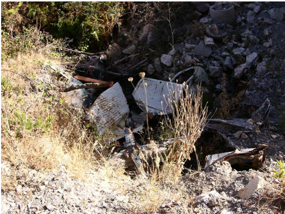
Desechos en el Arroyo de Calamocarro